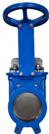
Válvula Guillotina (T200)