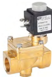
Solenoide para vapor (4425)