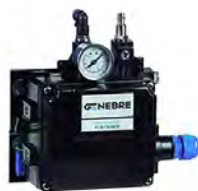
Posicionador Electro-Neumático (5952)