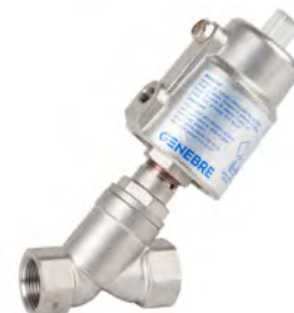
Válvula Asiento Inclinado con Actuador simple efecto (5060)