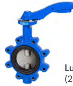
Lug ANSI - DIN (2108 - 2108A)