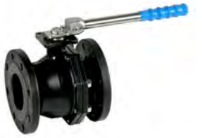
Flange ANSI Carbono (2526A)