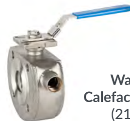
Wafer Calefaccionada (2119)