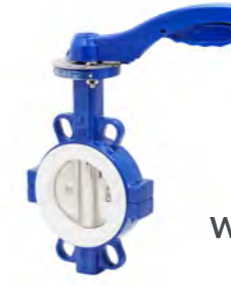
Wafer PTFE (2101)