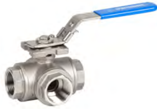
Tipo L-T Inoxidable (2040 - 2041)