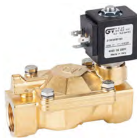
Válvula Solenoide (4020)