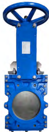
Válvula Guillotina (T300)