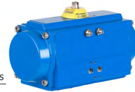
(Modelo 5800 GNP)