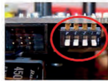
Posicionador con retransmisión de salida (5810) 4-20MA, 0-10V