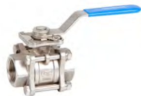
NPT - Socket Weld Inoxidable (2025N - 2027)