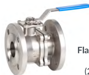
Flange DIN - ANSI Inoxidable (2528 - 2528A)