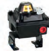
Limit Switch Indicador de posición (5987)