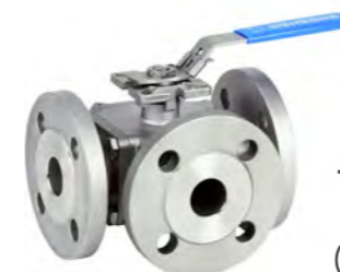
Tipo L-T Flange Inoxidable (2540E - 2541E)

Opcional para Válvulas de Bola V - Port 30° - 60° - 90°