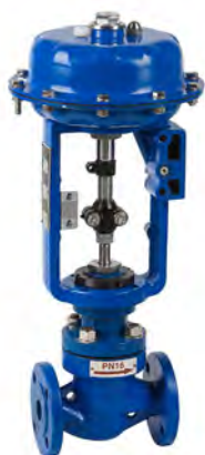
Válvula Control 2 vías (5065 - 5065A)

Revisa nuestro amplio stock en www.fitvalv.cl