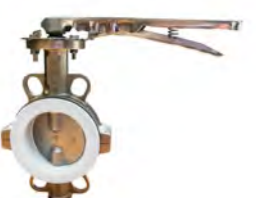
Wafer Full Inoxidable PTFE (2104)