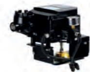
Posicionador con retransmisión de salida (5941) 4-20MA