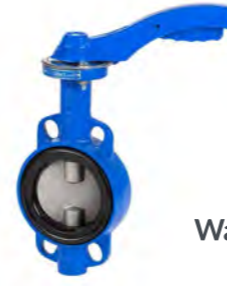
Wafer EPDM (2109)